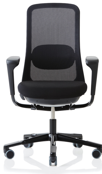
Design: Frost Produkt AS, Powerdesign AS et l'équipe Flokk Modèle déposé et breveté