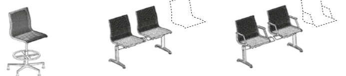
4PONL 24000 26000 24000 26000