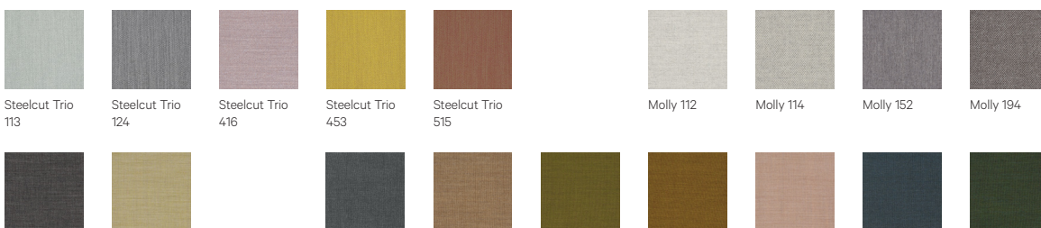
Steelcut Trio 113 | Steelcut Trio 124 | Steelcut Trio 416 | Steelcut Trio 453 | Steelcut Trio 515 | Molly 112 | Molly 114 | Molly 152 | Molly 194 | Canvas 154 | Canvas 414 | Remix 173 | Remix 252 | Remix 412 | Remix 422 | Remix 612 | Remix 873 | Remix 982

G1: Remix | G2: Molly, Canvas | G3: Steelcut Trio