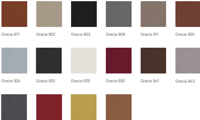
Gracia 917 | Gracia 902 | Gracia 903 | Gracia 908 | Gracia 911 | Gracia 920 | Gracia 924 | Gracia 925 | Gracia 929 | Gracia 930 | Gracia 941 | Gracia 943 | Gracia 944 | Gracia 945 | Gracia 950 | Gracia 967