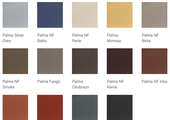
Palma Silver Grey | Palma NF Baltic | Palma NF Perle | Palma Mimosa | Palma NF Birke | Palma NF Smoke | Palma Fango | Palma Olivbraun | Palma NF Kenia | Palma NF Inka | Palma Whisky | Palma Lachs | Palma NF Antrazit | Palma NF Schwartz