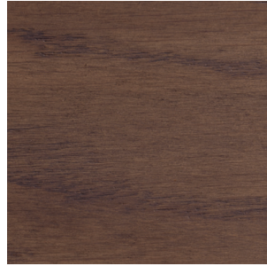
Ash Grey Oak