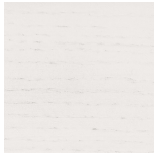
White Stained Oak