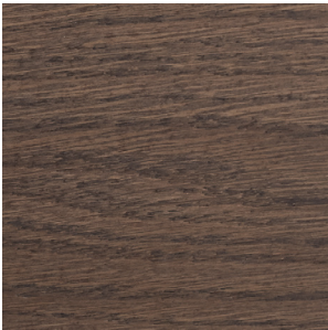
Walnut Stained Oak