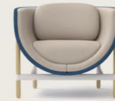
CAPSULE LOUNGE 1-SEATER