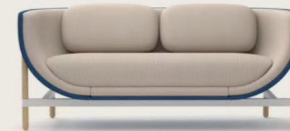
CAPSULE LOUNGE 2-SEATER