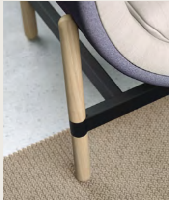
standard oak legs black powdercoated frame