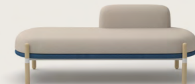
CAPSULE BENCH RIGHT/LEFT BACKREST 4236/08 - 4236/09