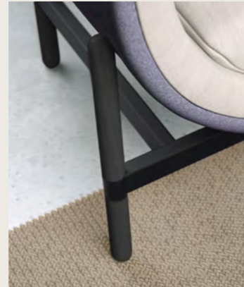
black varnished legs black powdercoated frame