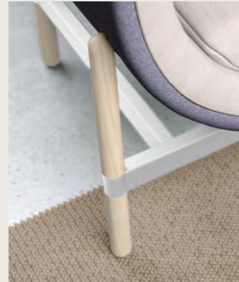
white wash oak legs white powdercoated frame