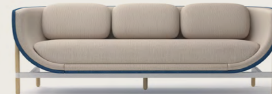
CAPSULE LOUNGE 3-SEATER